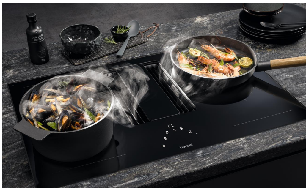
Premium-Lösung für saubere Luft in der Küche – berbel Downline aus dem Hause WESCO

Erfolg spornt an, und entsprechend hat WESCO das Modell weiterentwickelt – für erhöhten Bedienkomfort und mit noch mehr Raffinesse.