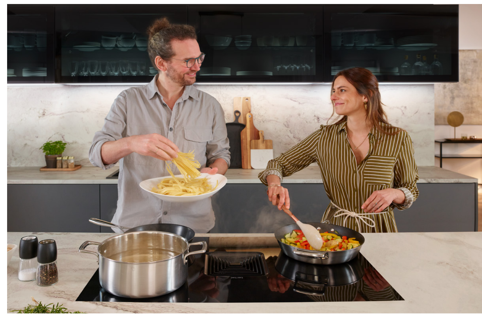
Surface Protect Compact Clean Vertical Flow