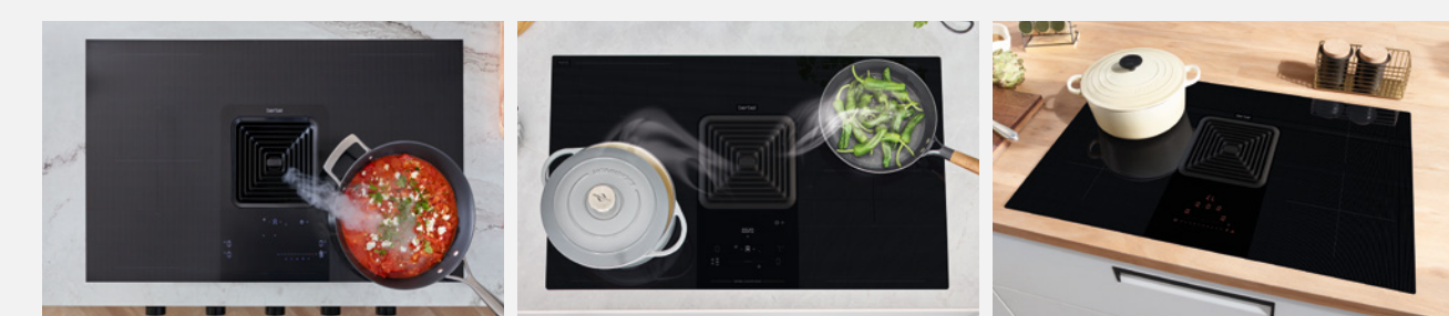
Downline Infinity Pro Downline Advance Downline Compact