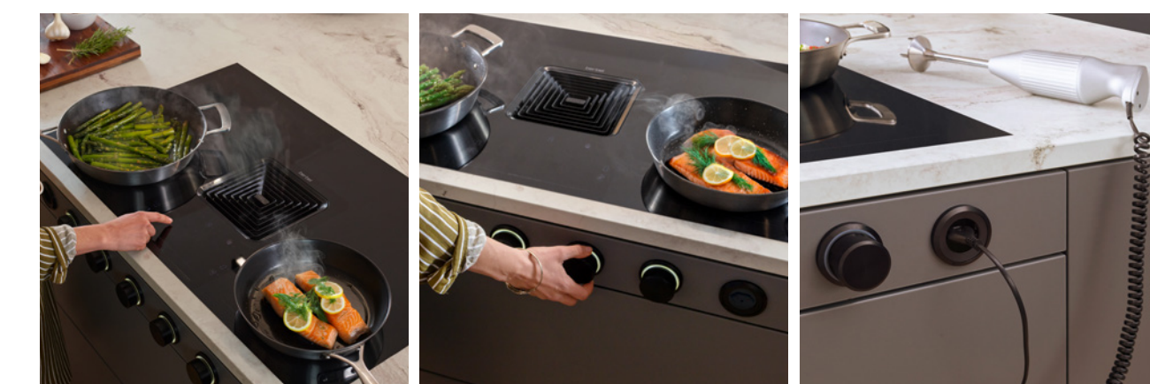
Eine perfekte Bedienkombination: Regulierungen können beliebig über Drehen an den Reglern oder Tippen auf dem Bedienfeld gemacht werden.

Die Downline Infinity Pro in Kombination mit Drehregler (optional erhältlich in Schwarz oder Edelstahl) verleiht Ihrer Küche das gewisse Etwas.