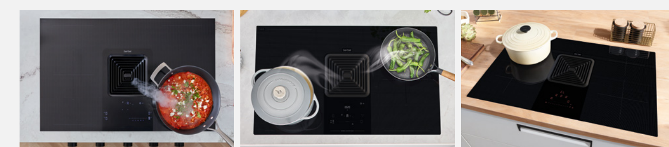
Downline Infinity Pro Downline Advance Downline Compact