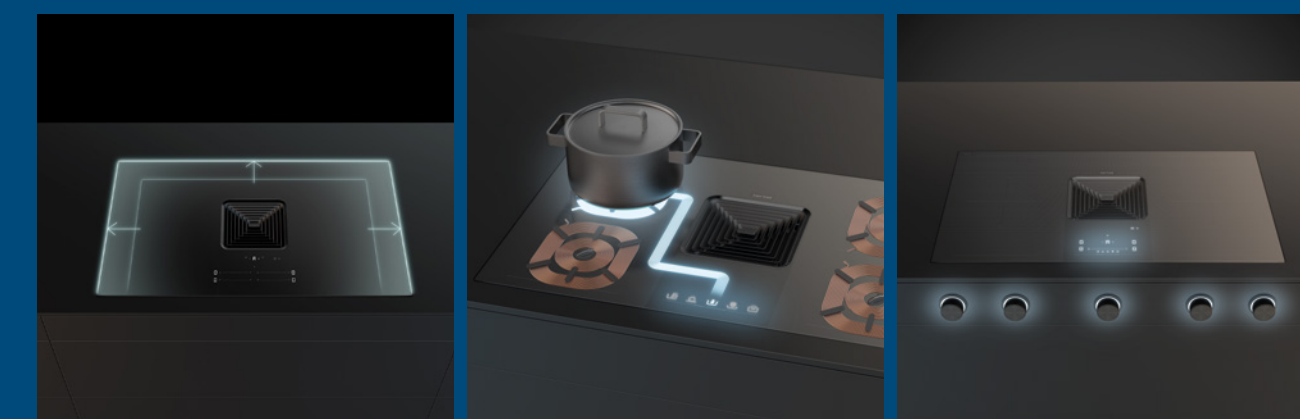
Infinity Space Clever Cook Premium Control

Die Downline Infinity Pro passt perfekt zu modernen Wohnküchen. Sie fügt sich nahtlos ein, unterstützt mit intelligenter Technik und schafft Raum für das, was wirklich zählt: gute Gespräche, feine Gerichte und gemeinsames Erleben.